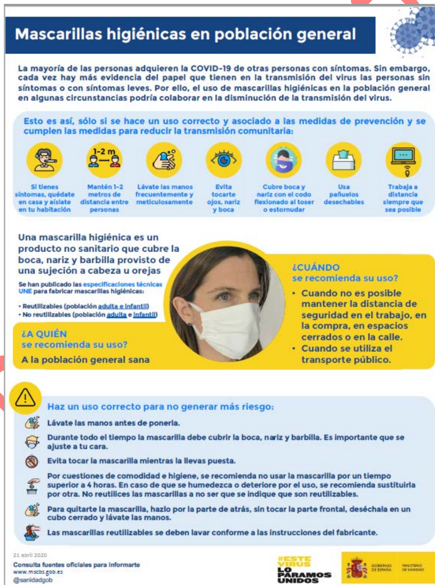
Mascarillas higiénicas en población general (Ministerio de Sanidad, 2020)

En ningún caso deberá tocarse la parte frontal de la mascarilla con las manos durante su uso y retirada.